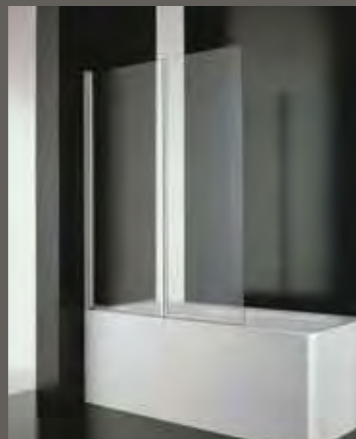
NP 60 60+50 h 150,5 NP 65 65+55