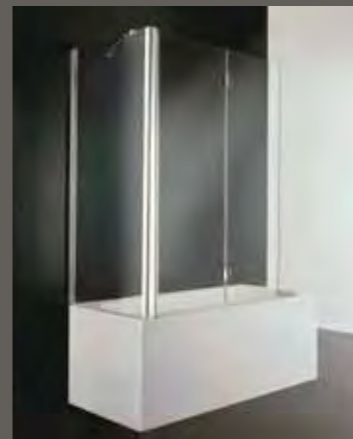
SV 60 60+50 h 150,5

SI su misura sur mesure on measure nach Mass a medida h 150,5