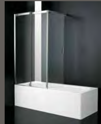
VR 60÷90 h 150

SE su misura sur mesure on measure nach Mass a medida h 152,5