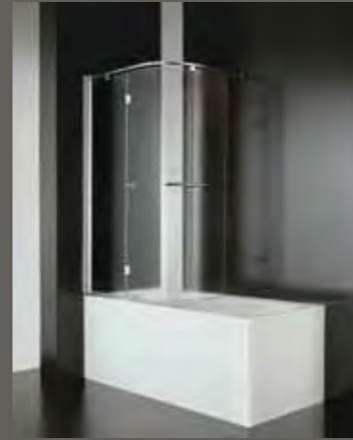
SR 60÷88 92 h 152,5