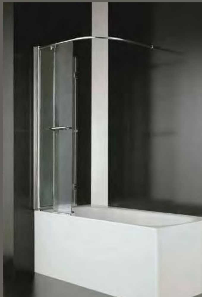
replay parentesi SR patented

su misura sur mesure on measure nach Mass a medida h 152,5