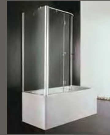
SR 60÷88 92 h 152,5

SE su misura sur mesure on measure nach Mass a medida h 152,5