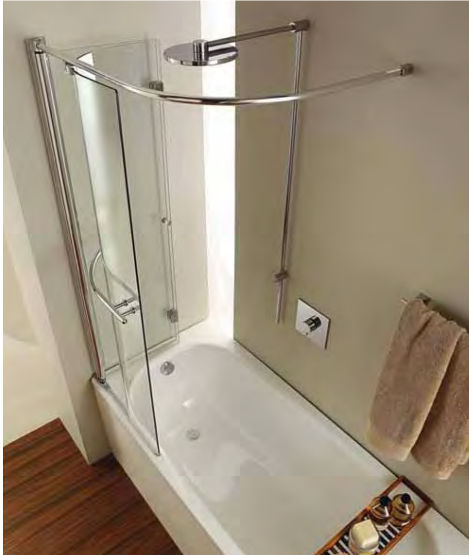
replay parentesi SR patented