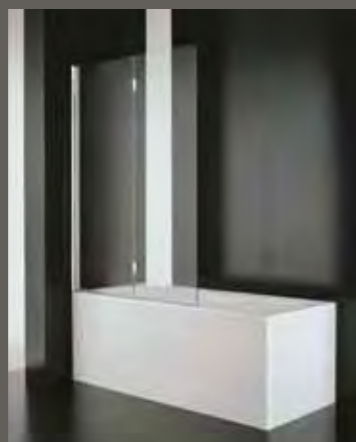
SV 60 60+50 h 150,5