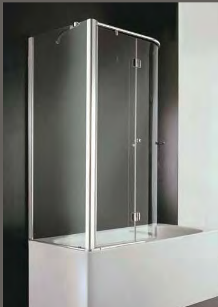
replay parentesi SR+SE