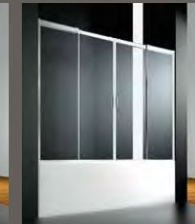
B4 su misura sur mesure on measure nach Mass a medida 160÷219 h 150