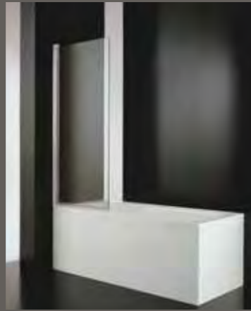
AV 70 70÷72 h 150 AV 80 80÷82 AV 90 90÷92