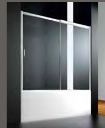
BN su misura sur mesure on measure nach Mass a medida 140÷179 h 150