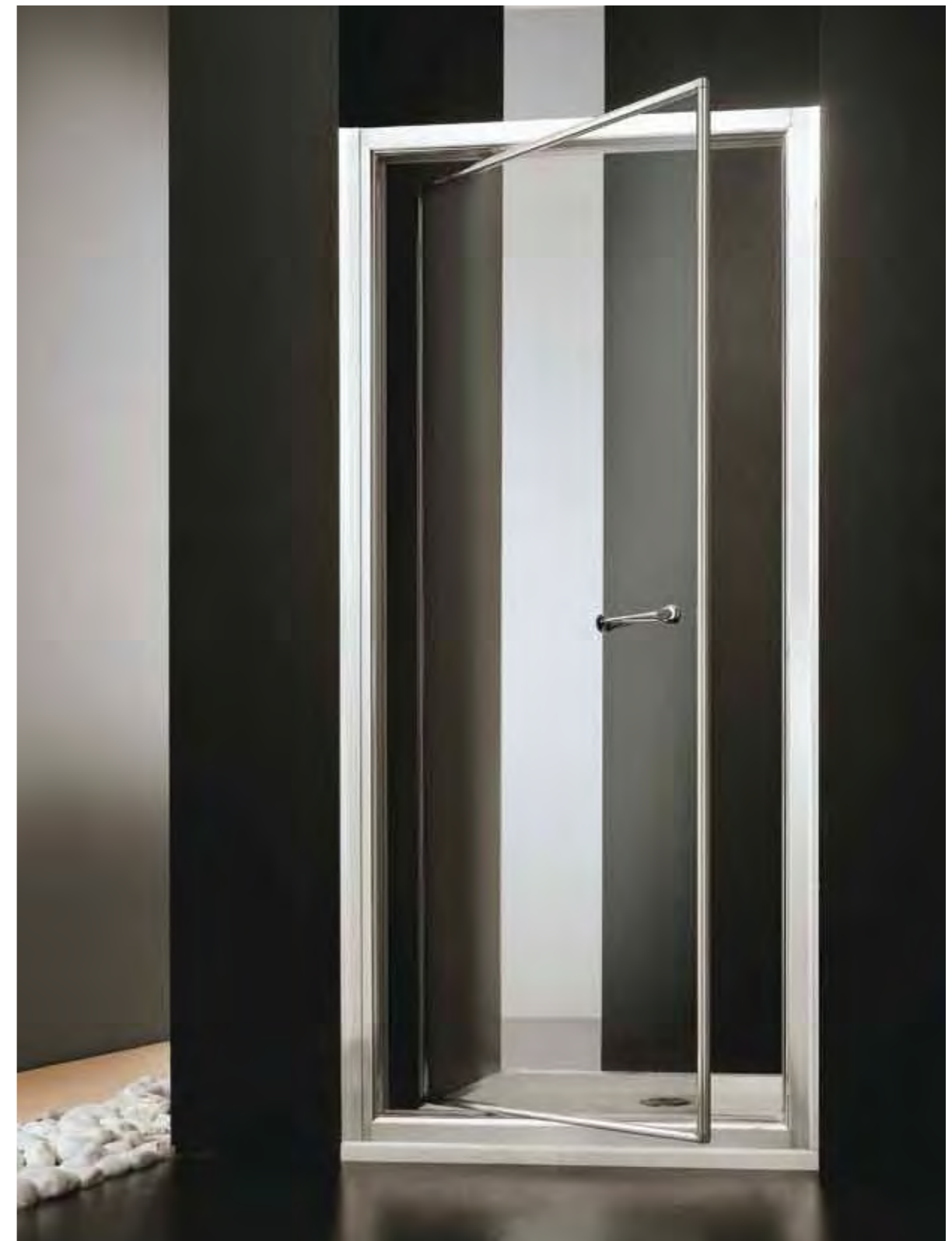
domino anta AN

PN 70 67÷72 h 188 PN 75 72÷77 PN 80 77÷82 PN 85 82÷87 PN 90 87÷92