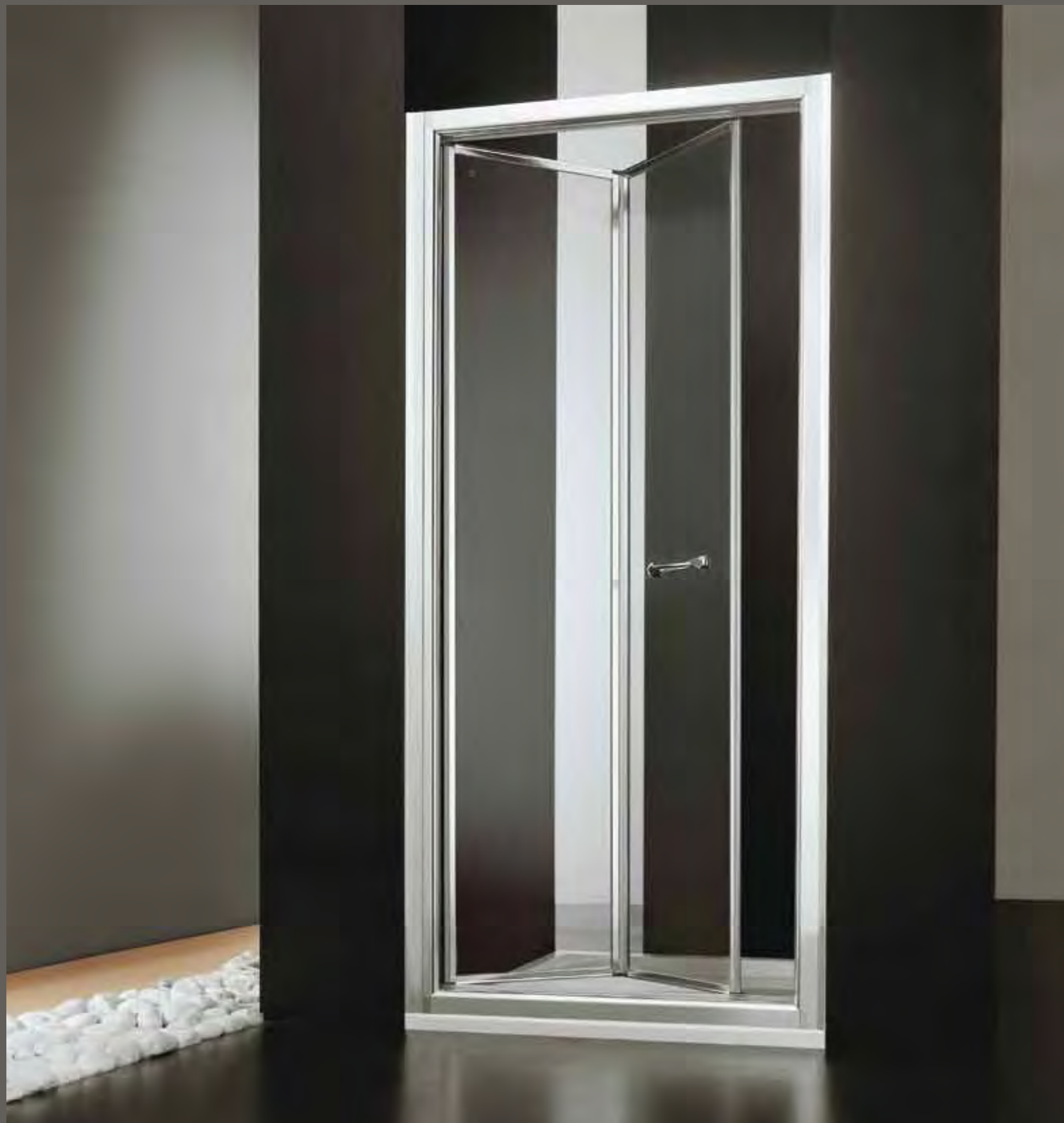
domino pia PN

PN 70 67÷72 h 188 PN 75 72÷77 PN 80 77÷82 PN 85 82÷87 PN 90 87÷92