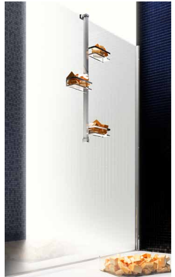
design Idelfonso Colombo sviluppo Centro Progetti Vismara

In this version, the bar hooks to the glass of the shower enclosure